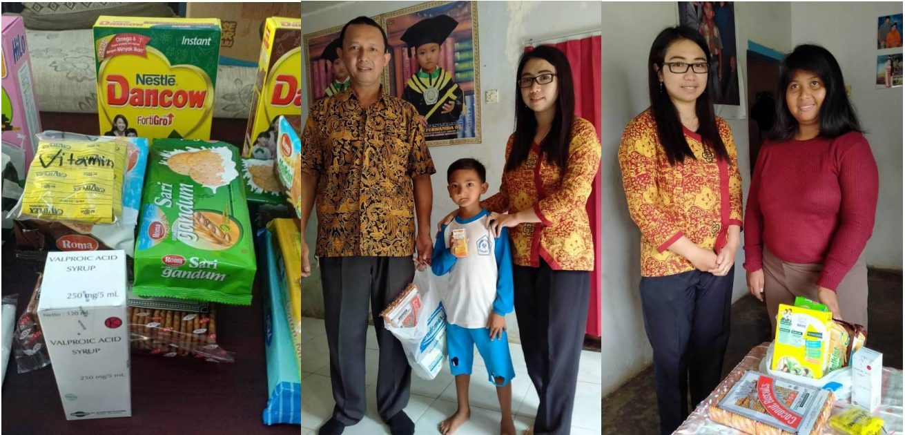
Maandelijks worden vitamines, gezonde voeding en medicijnen verstrekt