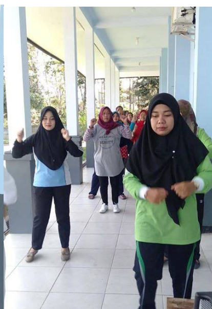
Gymlessen voor dames

Ook in de kliniek hebben ze te maken met aanpassingen in verband met Corona. Er wordt ter plekke en in de social media volop aandacht hiervoor gevraagd. Medewerkers van de kliniek bezoeken de fabrieken in de omgeving om ook daar voorlichting te geven over de hygienemaatregelen.