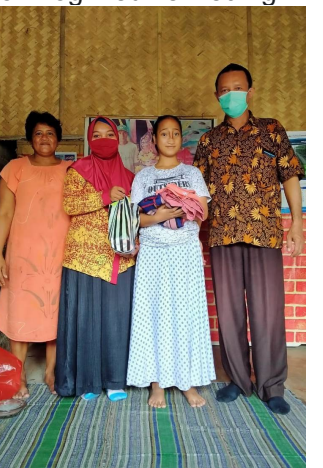
Kadootjes en nieuwe kleding ter gelegenheid van het Suikerfeest