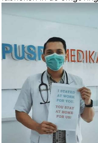
Aandacht voor corona

Ook in de kliniek hebben ze te maken met aanpassingen in verband met Corona. Er wordt ter plekke en in de social media volop aandacht hiervoor gevraagd. Medewerkers van de kliniek bezoeken de fabrieken in de omgeving om ook daar voorlichting te geven over de hygienemaatregelen.