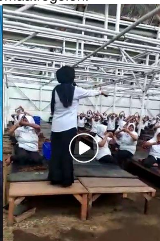
Voorlichting in een fabriek