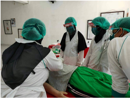
Dinda tijdens het oefenen van de skills: reanimatie