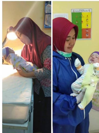
De afdeling verloskunde heeft voldoende werk