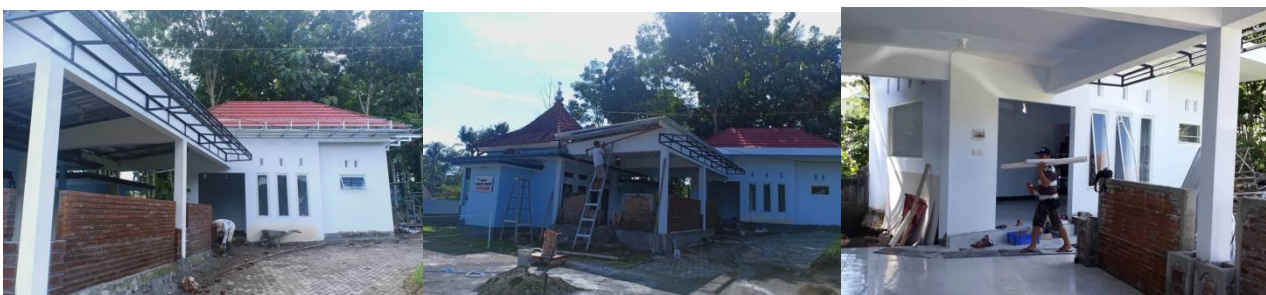
Bouw van de kantine in diverse stadia

In de nieuwsbrief van februari vertelden we u dat de bouw van een kantine/restaurant was gestart. Dit projectonderdeel is nu afgerond, maar de opening is vanwege corona uitgesteld.