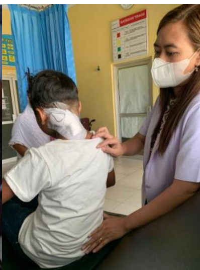
Celsi: nazorg in kliniek