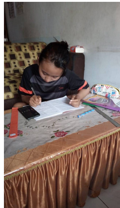
Online lessen Dini