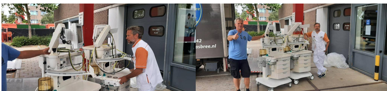
Overdracht van de anesthesie-apparaten van VieCuri aan onze stichting

Ziekenhuis VieCuri in Venlo is gestart met het vernieuwen van de operatiekamers. Hierdoor is een gedeelte van de apparatuur overbodig en hebben ze 2 anesthesie-apparaten geschonken aan onze stichting. Te zijner tijd worden de apparaten getransporteerd naar Indonesië voor gebruik in de kliniek in Garahan. We hopen dat we nog meer apparatuur mogen ontvangen.