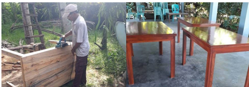
Het meubilair in de maak