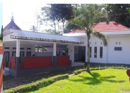
De kantine is gereed