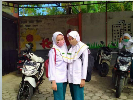
Yuli gaat gedeeltelijk weer naar school