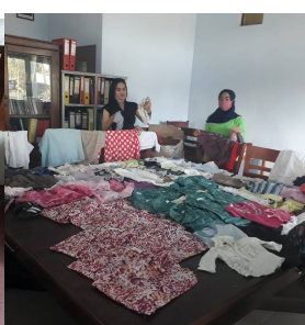
De pakketten kleding komen binnen, worden uitgepakt en gesorteerd