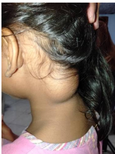
Celsi voor operatie

Verder dragen we bij aan de kosten voor operaties. Zo zijn er het eerste half jaar van 2020 weer 2 kinderen geopereerd: Celsi is een meisje van 9 jaar dat een gezwel op achterhoofd/hals had en Devano (2 jaar) die aan elkaar gegroeide vingers en tenen had. De kosten bedragen ongeveer 1000 Euro per operatie.