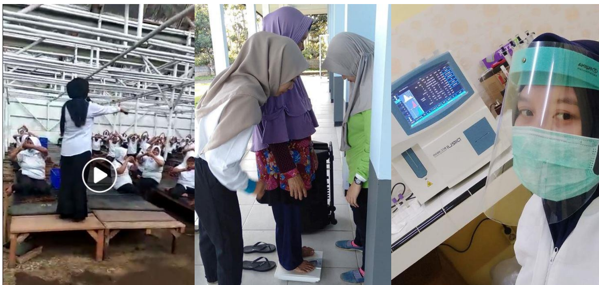
Voorlichting over corona