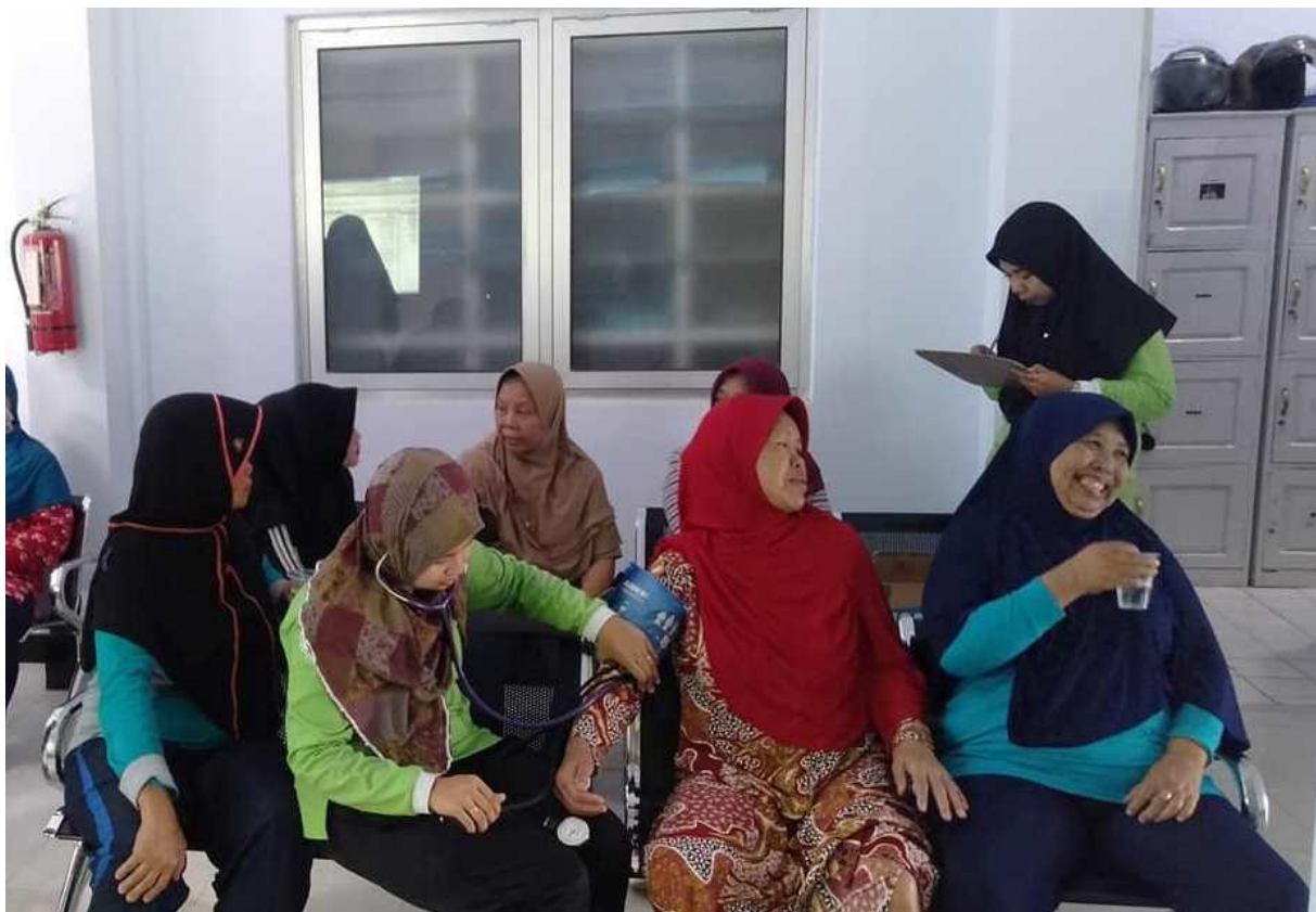
Gezondheidscheck in de kliniek in Garahan