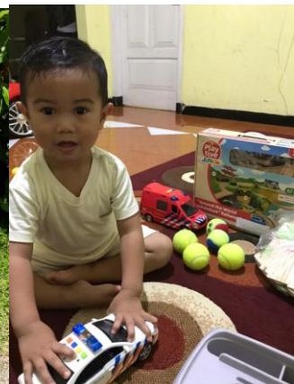
Uitdelen van de kleding en het speelgoed: blijе gezichtjes