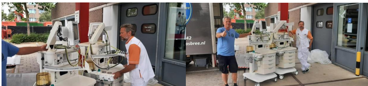
De anesthesie-apparaten die we van VieCuri hebben ontvangen