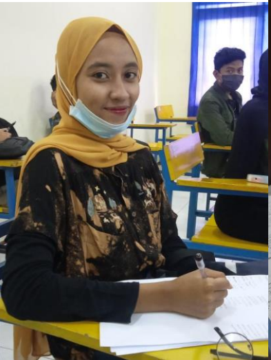
Novita: gedeeltelijk les op school en gedeeltelijk online