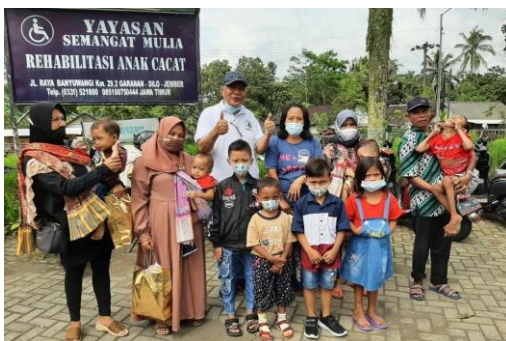
Bijeenkomst in Garahan