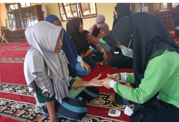
Gratis gezondheidschecks ter plekke