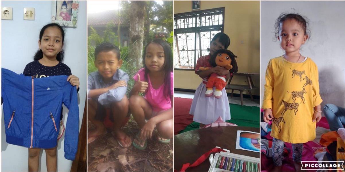
Blijde kinderen met hun nieuwe kleding