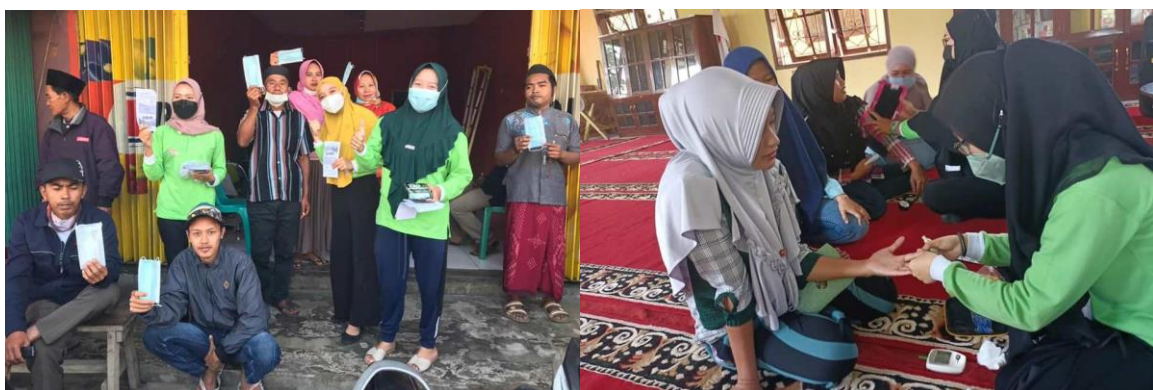
Uitdelen mondkapjes tijdens pandemie