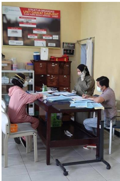
De 1 e hulppost

Eind december heeft de kliniek 44 medewerkers in dienst.