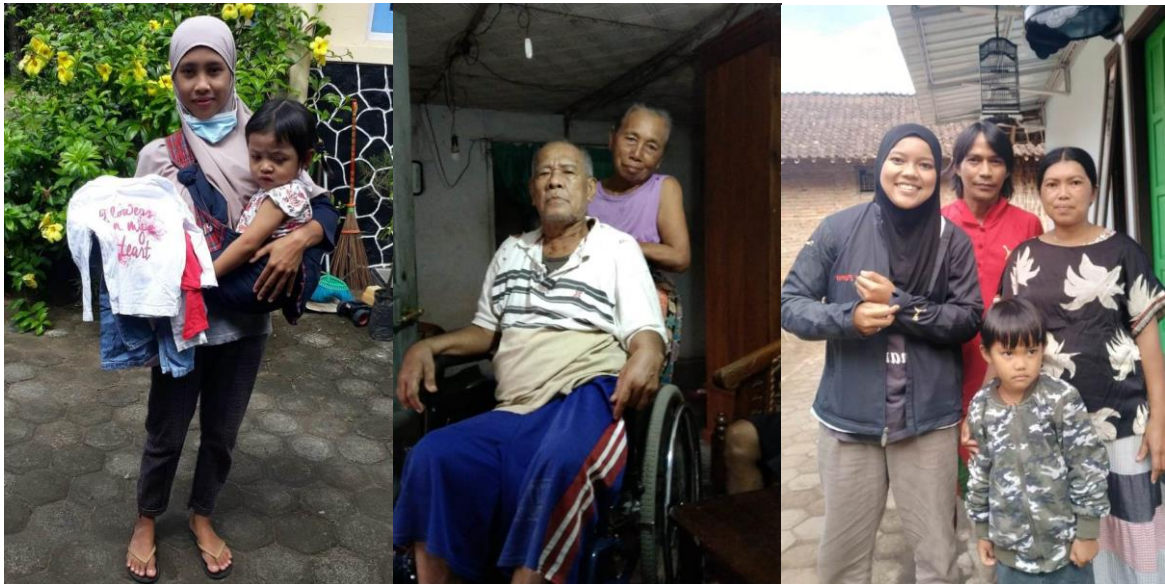
Nieuwe kleding en de rolstoelen zijn verdeeld