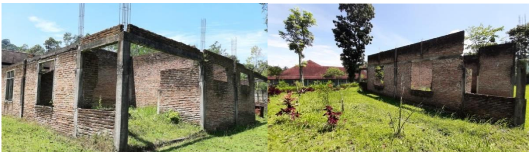
Het gedeeltelijk aanwezige gebouw dat als basis dient voor de isolatiekamers