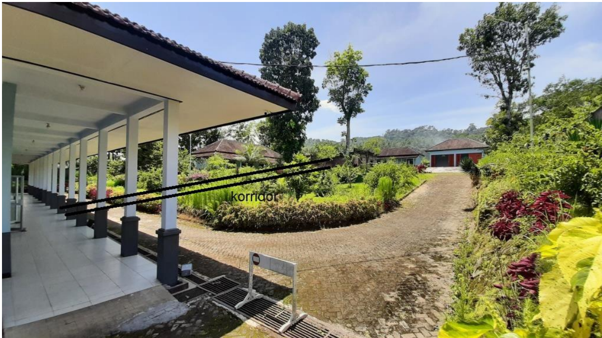
Positie korridor van hoofdgebouw naar isolatiekamers