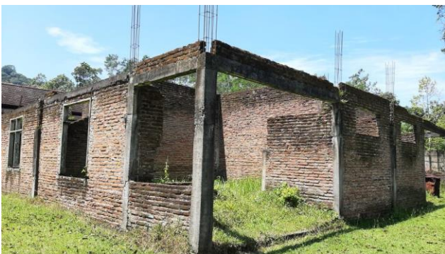
Het gedeeltelijk aanwezige gebouw dat als basis dient

Sinds 2021 zijn er vanuit de overheid aanvullende eisen gesteld aan verpleging van patiënten met zeer besmettelijke ziektes (bijvoorbeeld longtuberculose, buiktyfus, paratyfus, difterie en Covid). Deze mogen niet meer in op de afdeling met reguliere verpleegkamers worden verzorgd, maar moeten in een afgescheiden afdeling worden verzorgd die uitsluitend hiervoor dient.