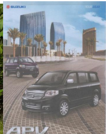
We willen de 15 jaar oude bus vervangen door een personenauto