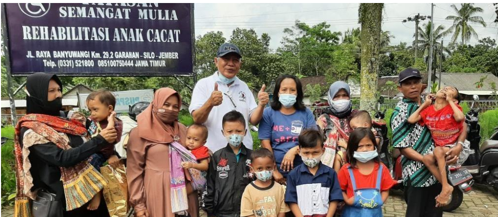
Een aantal van de gehandicapte kinderen die wij helpen