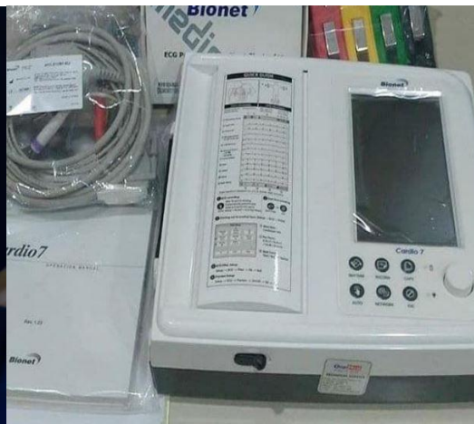
ECG apparatuur is een nieuwe eis