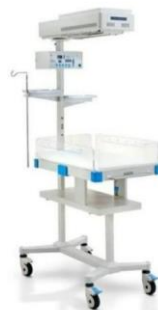
Voor moeder en kindzorg is o.a. een beademingsballon en een verwarmd bedje een vereiste