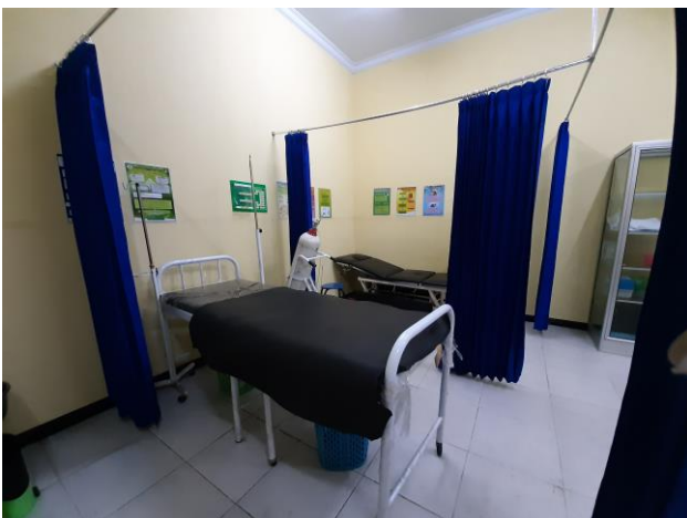
Gordijnen moeten vervangen worden door plastic gordijnen