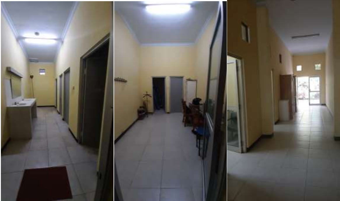
Een van de toiletunits