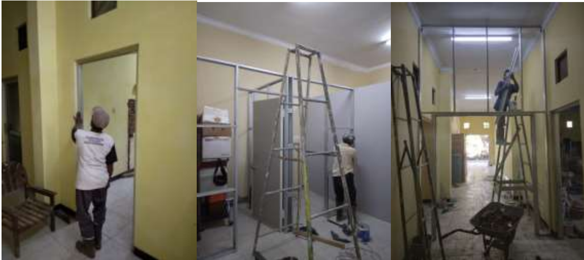
Plaatsen deur isolatiekamer, kleedkamer verplaatsen en het plaatsen van de tussendeur