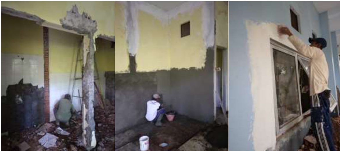
Afbraak toiletunit, bijwerken van de muren en het plaatsen van een raam