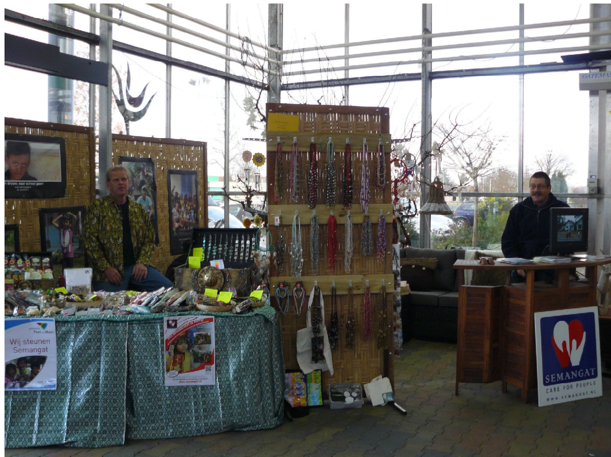
Kerstmarkt bij Groenrijk Maasbree