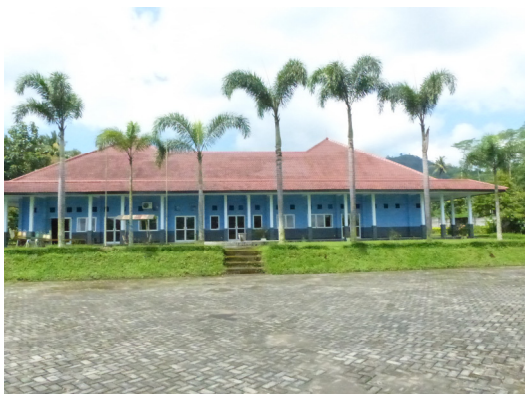
De polikliniek in Garahan

Bijkomend voordeel is dat voor de gehandicapte kinderen die in Surabaya geopereerd worden, de nazorg volledig ter plekke uitgevoerd kan worden zodat de geopereerde kinderen en hun ouders niet iedere keer de lange reis (van minimaal 6 uur enkele reis) naar Surabaya hoeven te maken.