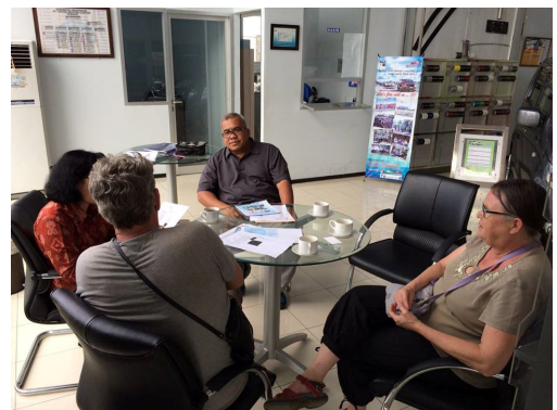
Informeren naar de kosten van een ambulance

Na een aantal aanpassingen zijn wij akkoord gegaan met de door Semangat Mulia opgestelde begroting.