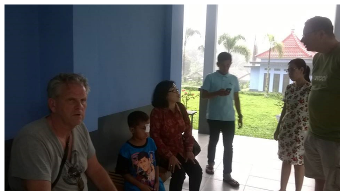
Nazorg voor een van de geopereerde kinderen