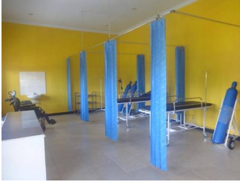
Ingerichte 1 e hulp