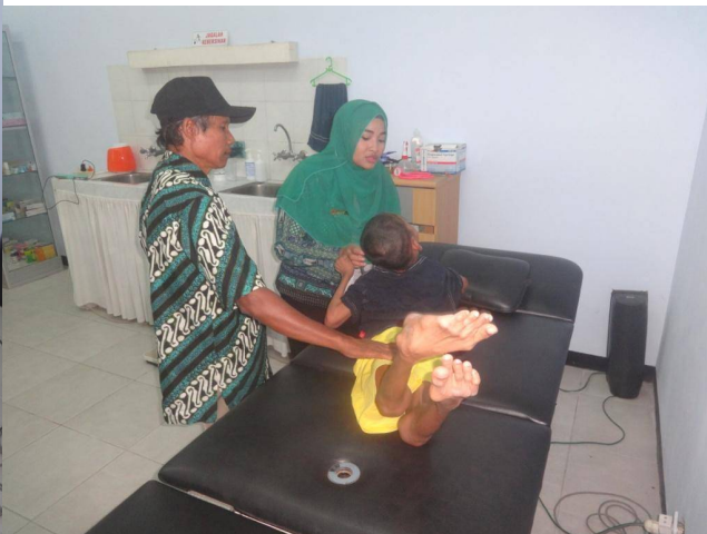
Maandelijks check van gehandicapte kinderen