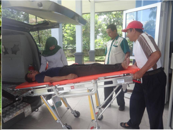
Oefening voor het personeel