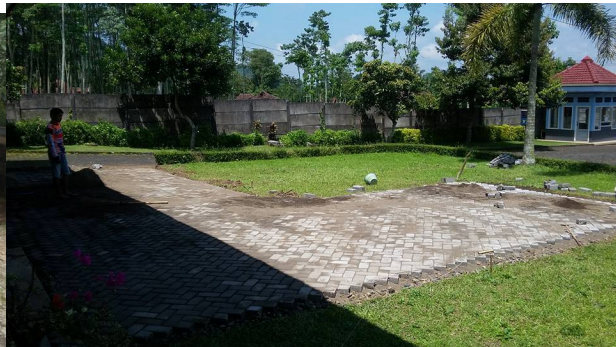
De auto die tot ambulance wordt omgebouwd en de aanleg van de oprit bij de kliniek