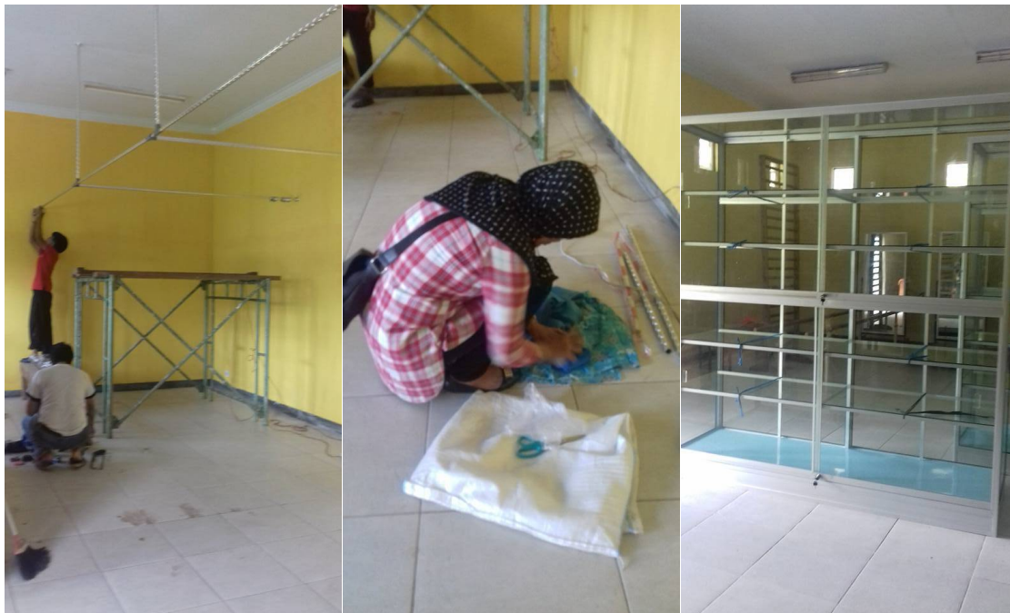
Verbouwing en herinrichting van de ruimtes