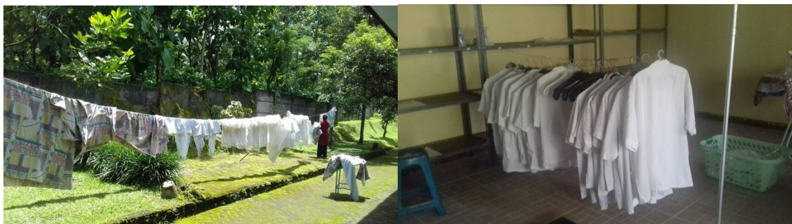
Hergebruik van reeds aanwezige middelen