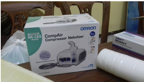
Een gedeelte van de medische apparatuur