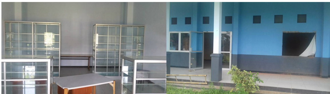
De apotheek wordt ingericht