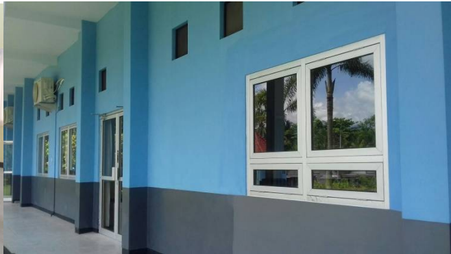
Loket 1 e hulp