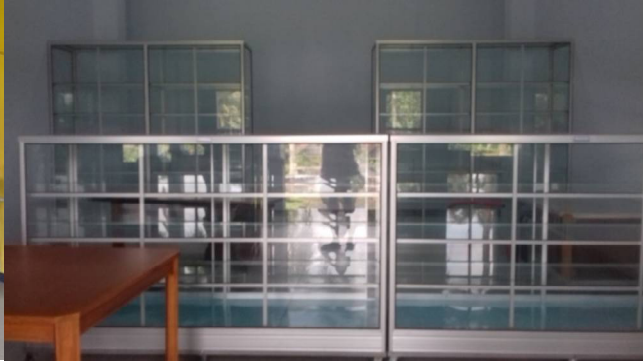
De apotheek is klaar