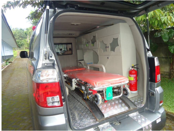
De ambulance is klaar