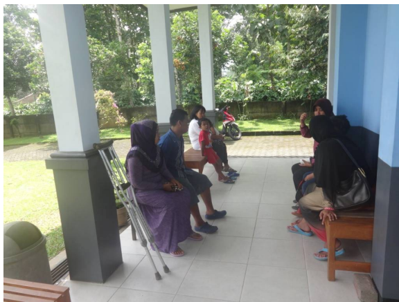
Wachten op de arts